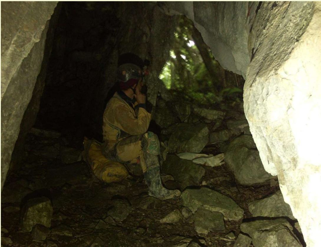
Entrada Cueva Tonio