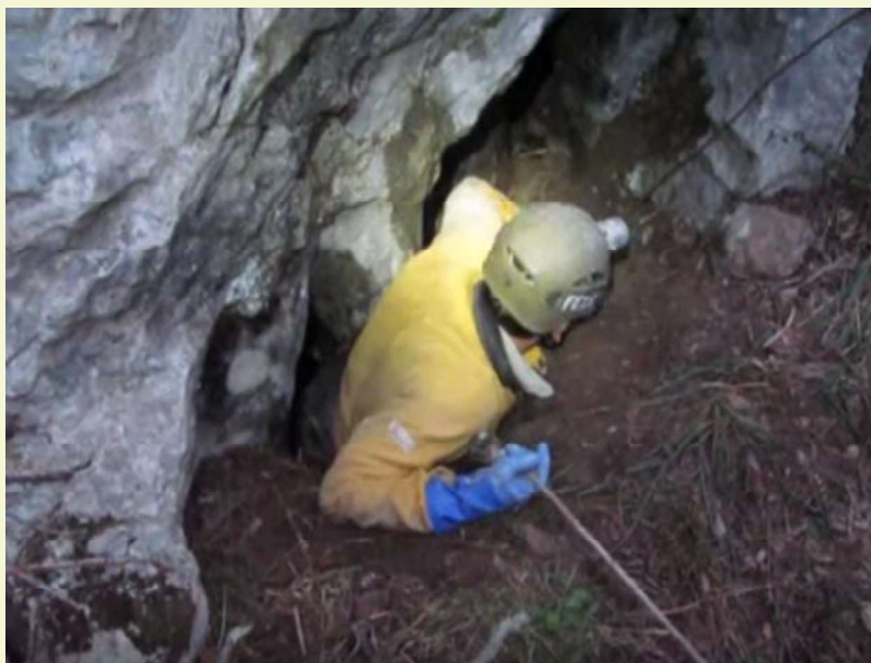
Entrada a Torca London

Esta torca se localizó a finales del 2014, saliendo de explorar de la Cueva Tonio. Por su boca de entrada, salía una fuerte corriente de aire, pero sus reducidas dimensiones, no nos permitieron acceder en ese momento.